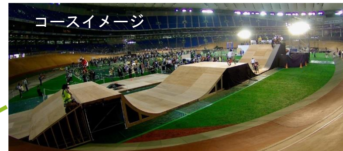
ステージ兼スタートヒルイメージ